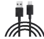
Cable de datos USB tipo C

Ajuste el ángulo de grabación girando 30° cada vez, máximo 360°.