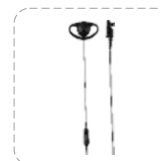
Auricular tipo D