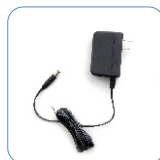
Adaptador de energía 12 V/1 A