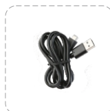
Cable de tipo-C