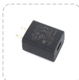
Adaptador de energía (USB)