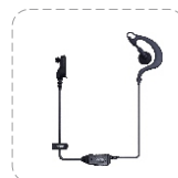
Auricular tipo C