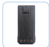
Batería de Li-ion 1500 mAh

ACCESORIOS ESTÁNDAR: ACCESORIOS OPCIONALES: