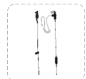
Auricular con tubo acústico transparente