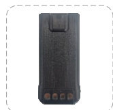
Batería de Li-ion 2400 mAh