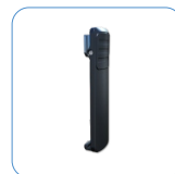
Clip para el cinturón