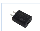
Adaptador de corriente