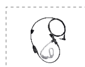
Auricular con cable