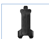
Clip para cinturón