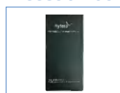
Batería de Li-ion