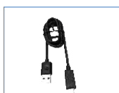
Cable de datos